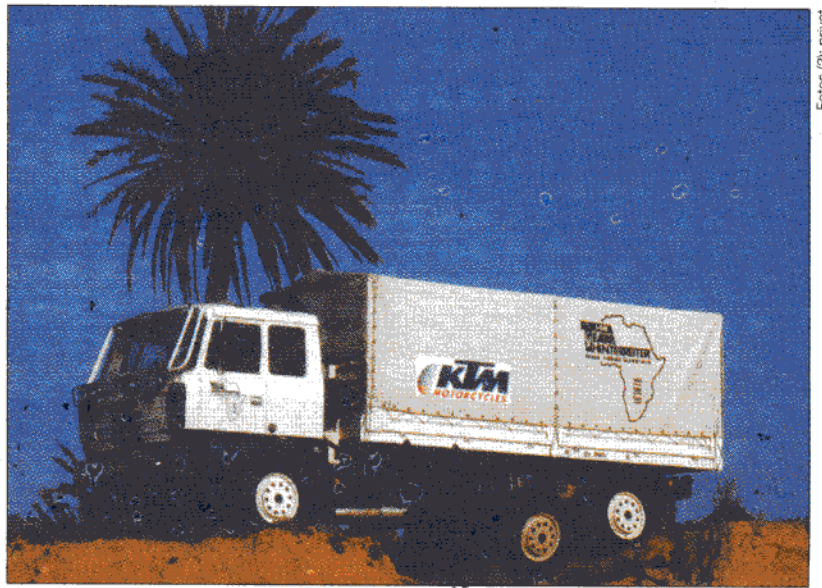
Unebenheiten bis zu 1,5 m gleicht die Einzelradaufhängung des Tatra aus.

Die Doppelbelastung – zum einen im Rennen gut mitzuhalten und zum anderen den Truck unbedingt ins Ziel bringen zu müssen, weil die Motorradfahrer davon abhängig