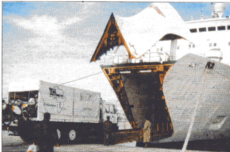
Über das Mittelmeer geht es logischerweise per Schiff.

An den Sieg in der Truck-Wertung denken die drei überhaupt nicht, denn sie haben eines der schwersten Fahrzeuge und von KTM (ohne diese Kooperation könnten sie es sich gar nicht leisten, mitzufahren) den klaren Auftrag, durchzukommen. „Einige wenige haben den Vorteil, daß sie leer fahren können. Die werden gewinnen“,